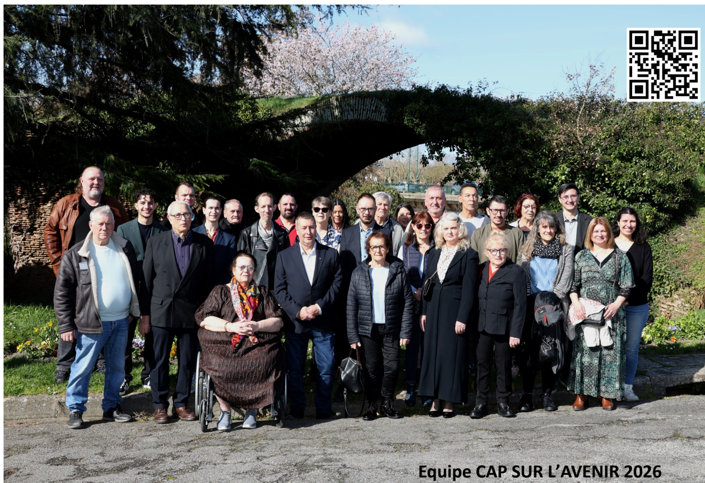
Equipe CAP SUR L'AVENIR 2026